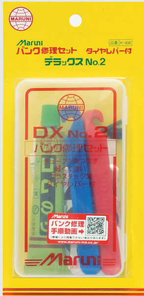
デラックス NO.2 (1ヶ付)