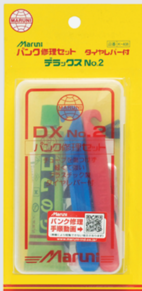
デラックス NO.2 (1ヶ付)