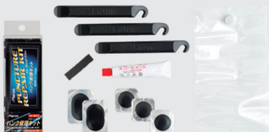
ロードバイク用 パンク修理キットレバー付